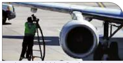
to improve the job benefits of 470 employees