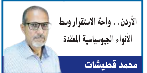
الأردن . واحة الاستقرار وسط الأنواء الجيوسياسية المعقدة