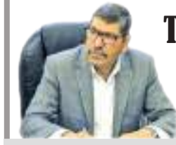
The bakers sons...!!