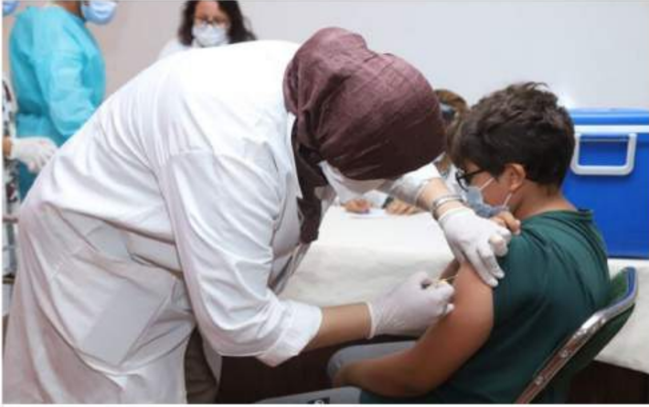
أكثر، إذا لم يتسبب في مضاعفات خطيرة كالتهاب الخصيتين أو دمور إحداهما، فضلاً عن التهاب السحايا الفيروسي، أو انتقاله لدماع الانسان، في أشهرها الأولى، عن طريق العدوى، فير أنه لن يسبب لها مضاعفات خطيرة. وأكد أن الفيروس يمكن أن ينتقل للمرأة العاملة

يعاني عدد من الأطفال خلال هذه الفترة من التهاب الغدة التلغابية على أحد الجانبين أو كلاهما، نتيجة للإصابة بفيروس يسمى "التهاب"، وهو مرض معدى يصيب الأطفال في جميع الفئات العمرية وله مضاعفات وأعراض خطيرة. فما هو هذا المرض؟ وأين تكمن خطورته؟ وكيف يمكن الوقاية منه؟ "التهاب" هو مرض فيروسي يصيب الغدة التلغابية وهي واحدة من ثلاثة أزواج من الغدة "التلغابية" المنتجة لللعاب، وتقع تحت وأمام اللسان. ويمكن أن يسبب تورمها الألم عند اللمس. يشرح الطبيب حمضي، الطبيب والباحث في السياسات والنظم الصحية، أنه من أهم الأعراض التي يسببها هذا الفيروس هي التهاب الغدة التلغابية على أحد الجانبين أو كلاهما، والحمى والسعال، بالإضافة إلى الإحساس بالغث والقدان الشهية، بالإضافة إلى الألم أثناء البلع أو البلع. وأضاف حمضي، في تصريح لوقع الإولى، أن ٩٠ في المائة من الأشخاص الذين يصلون لمن البلوغ يكونون قد أصيبوا بالتهاب في صغر سنهم، فير أن الدول التي تعمم التلقيح ضد هذا المرض في صفوف مواطنيها لا تعرف حالات كثيرة. ويأتى تسجيل حالات إصابة عند كبار السن الذين لم يسبق لهم التلقيح ضد هذا الفيروس في مرحلة الطفولة. ويوضح أن ٣٠ في المائة من الأطفال الذين يصلون بهذا الفيروس لا تظهر عليهم أعراض الإصابة، بينما أن ٧٠ في المائة من الصغار به تظهر عليهم هذه الأعراض، مؤكداً أن مدة الإصابة بهذا المرض قد تصل إلى عشرة أيام أو