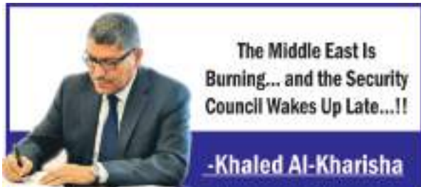
The Middle East Is Burning... and the Security Council Wakes Up Late...!!