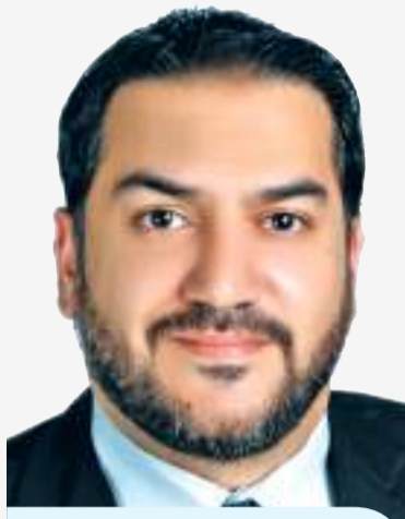
الرمحي: العقد الإلكتروني أنصف المعلم والتعديلات حرمته من راتب آب

وأكد، أن نجاح هذا النموذج يتطلب نظاماً رقابياً فعالاً يضمن تطبيق هذه المعايير، ويمنح المدارس القدرة على التطوير والابتكار، بما يعكس في النهاية على جودة التعليم ومخرجاته الوطنية.