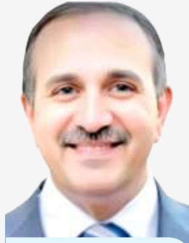
تايه: إلغاء العقود الموحدة يهدد استقرار المعلم ويمس جوهر العملية التعليمية

المعلمين بين المدارس، نتيجة اختلاف قدرات المؤسسات وسياساتها الإدارية، وحتى فلسفتها في إدارة الموارد البشرية، موضحاً أن بعض المدارس قد تعتمد نماذج متقدمة، فيما قد تتجه أخرى لتقليل الكلف التشغيلية عبر تقليص الامتيازات.