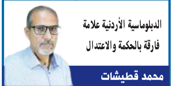
الدبلوماسية الأردنية علامة فارقة بالحكمة والاعتدال