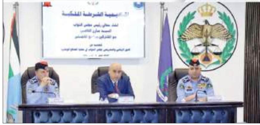
عادل القاضي الفلسطينية، تلك التي أسهم الإنكار الدولي في المنطة. وسلبت القاضي الضوء على تطور الحياة السياسية في لها وغياب الحل الشامل والعادل عنها، إلى تلامي التوت

أكد رئيس مجلس النواب، مازن القاضي، على الدور الحيوي لمجلس النواب في منظومة الأداء الوطني الشامل، باعتباره ممثلاً للشعب والشريك الرئيس في صناعة القرار ضمن مؤسسات الدولة كافة.