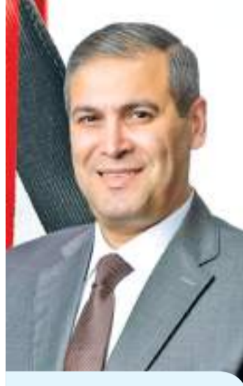
سلطان: تثبيت «موديز» يعكس متانة الاقتصاد الأردني

قطاع محوري يحظى بثقة كبيرة من المواطن والحكومة على حد سواء، ويشكل ركيزة أساسية في دعم النمو الاقتصادي.