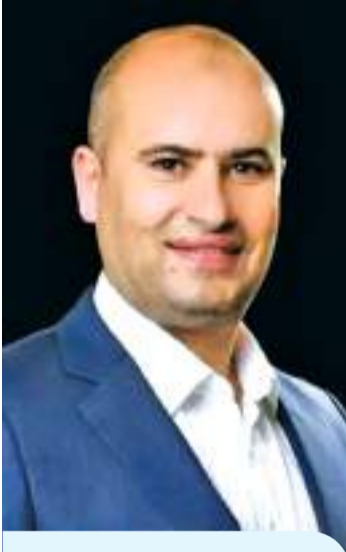
ديّة: التصنيف الائتماني يثبت قوة الإصلاحات والسياسات الاقتصادية

وأكد على أن استمرار الإصلاحات الاقتصادية وتحسين بيئة الأعمال من شأنه تعزيز ثقة الاقتصاد الوطني، ورفع المؤشرات الاقتصادية، ودعم قدرة الأردن على مواجهة التحديات الإقليمية والظروف الجيوسياسية المضطربة التي تؤثر على اقتصادات المنطقة.