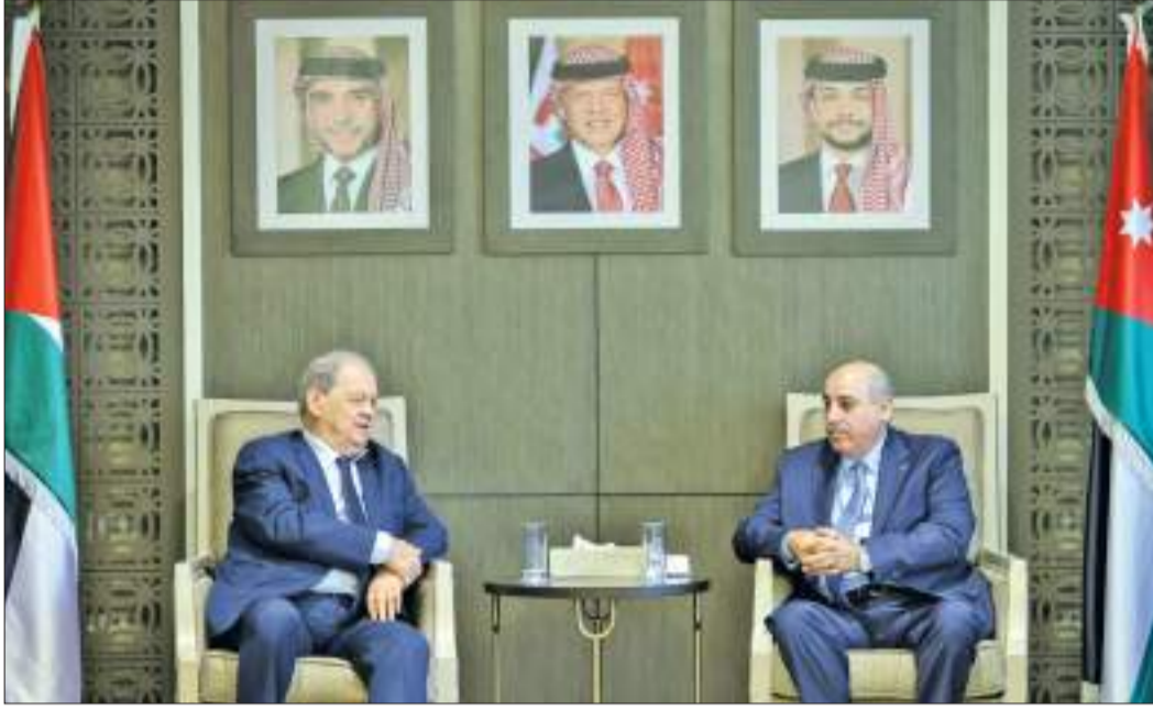
الشعب الفلسطيني، وحماية المقدسات الإسلامية والمسيحية في القدس، مشيرين إلى أن مواقف جلالة تعزز صمود الفلسطينيين. وشامل للقضية الفلسطينية، وفق قرارات الشرعية الدولية، هو السبيل الوحيد

وثن فتوح مواقف رئيس المجلس الداعمة للقضية الفلسطينية في مختلف المنابر البرلمانية، وكذلك جهود رئيس لجنة فلسطين في تقديم مواقف برلمانية داعمة للقضية، موجهاً تحية التقدير لأعضائها كافة