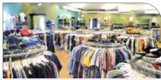
Summer and Eid al-Adha clothing are available in the local market at competitive prices

Amman The General Syndicate of Traders in Clothing, Footwear, and Fabrics confirmed the availability of various goods for the summer and Eid al-Adha seasons, across different categories and brands, in the local market at competitive prices.