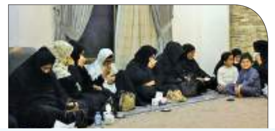
Iraqi women mourn Sajida Obaid, a singer who gave them a taste of freedom

Amman The General Syndicate of Traders in Clothing, Footwear, and Fabrics confirmed the availability of various goods for the summer and Eid al-Adha seasons, across different categories and brands, in the local market at competitive prices.