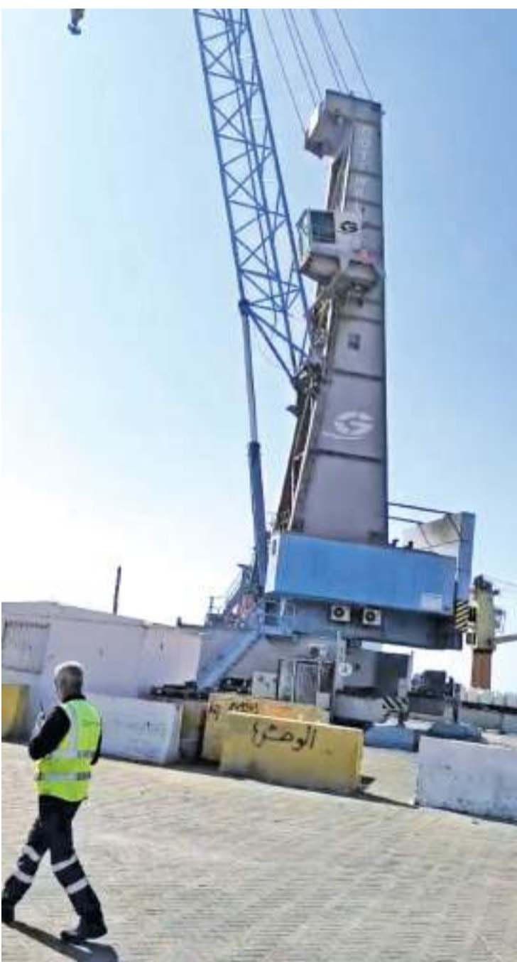
بعين الاعتبار مصلحة الميناء العليا ليبدأ طرح العطاء عام ٢٠٢٣ ثم المباشرة بعمليات

وينظر مختصون الى عمليات صيانة وتحديث الموبايل كرين على انه إنجاز وطني كبير يعود على الميناء وعلى الاقتصاد الوطني واقتصاديات زبائن الميناء بمختلف القطاعات .