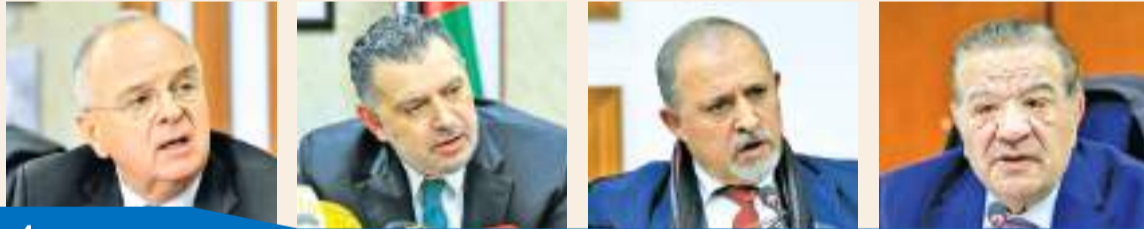
4 التفاصيل صفحة