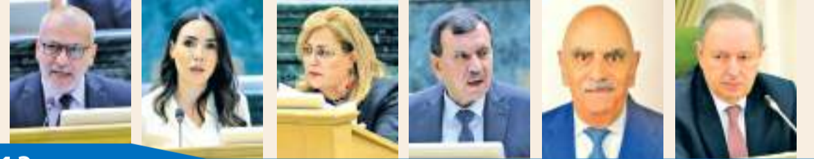
13 التفاصيل صفحة