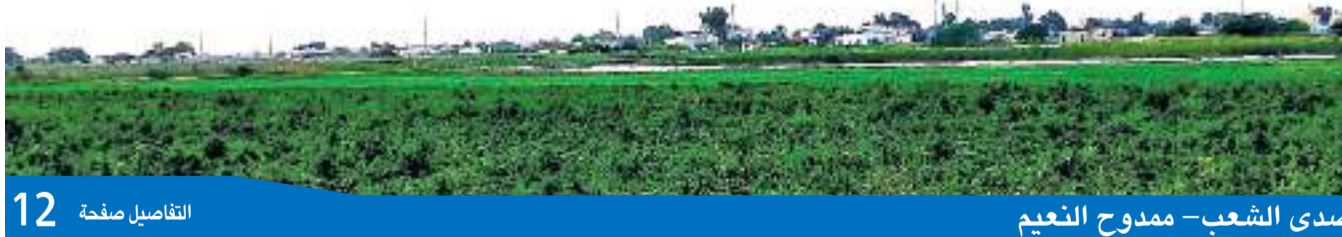
12 التفاصيل صفحة