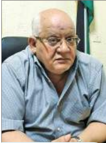
الدكتور احمد الحوارات مدير صحة ديرعلا الأسبق