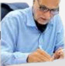
المستشار جميل سامي القاضي

تتدفق في شرايين الشعب الأردني الاصيل ثلاثة أنهار روحية لا تنضب، تتشابك مياهاها لتصنع نسج وجودنا وهويتنا: نهر البيعة والعهد الراسخ بين القيادة والشعب، ونهر الوفاء الذي تحول الى ثقافة راسخة في حباثتنا، ونهر الهوية الاردنية المتجذرة في عمق التاريخ والجغرافيا.