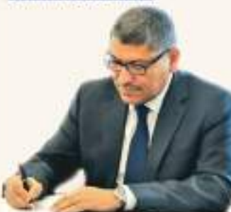
Stalled Negotiations and Muted Drums of War... Who Pulls the Trigger Between Washington and Tehran? Khaled Al-Kharisha