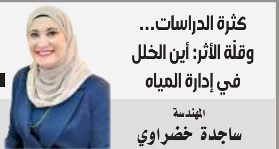
كثرة الدراسات... وقلة الأثر: أين الخلل في إدارة المياه المهندسة ساجدة خضراوي

على مدار سنوات طويلة، لم يتوقف الحديث عن أزمة المياه في الأردن، دراسات، تقارير، استراتيجيات، ومشاريع تُعلن تباعاً، ومع ذلك، ما زال المواطن يشعر بأن المشكلة تزداد تعقيداً، لا انحصاراً، هذا التناقض يطرح سؤالاً واقعياً لا يمكن تجاهله: لماذا لم تنعكس كثافة الدراسات على تحسّن ملموس في إدارة المياه.