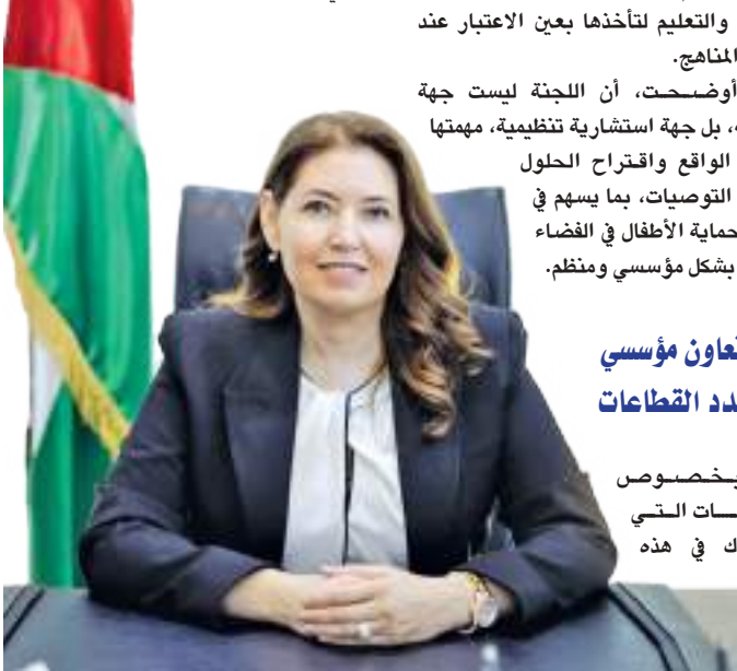
تعاون مؤسسي متعدد القطاعات