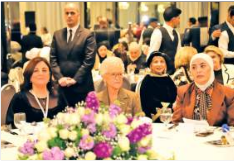
الحسين عددا من الشركاء والأصدقاء الداعمين، تقديرًا لجهودهم المميزة ومساندتهم القيمة، وإسهاماتهم البارزة في دعم رسالة الجمعية وتطوير خدماتها.