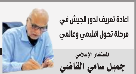
اعادة تعريف لدور الجيش في مرحلة تحول اقليمي وعالمي