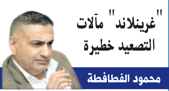
"غرينلاند" مآلات التصعيد خطيرة

ترامب، الذي لم يُخف يوماً استخفافه بالمؤسسات متعددة الأطراف، يرى في الأمم المتحدة عبئاً على القرار الأمريكي، لا شريكاً فيه لذلك فإن أي مجلس بديل لن يكون