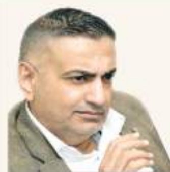
Between Trust and Responsibility: Why Jordan Has No Luxury of Absence

of the Financial System No. 132 of 2016, along with inquiries concerning financial affairs, employee affairs, professional and building licenses, procurement and supplies, use of government vehicles, and forms used in municipalities. Committee members stressed the need to activate internal audit units in municipalities, enhance continuous monitoring, and take practical steps to prevent the recurrence of violations. They emphasized the importance of supporting municipalities to improve service levels and ensure the optimal use of available resources. For his part, Al-Rahamna affirmed the Ministry of Local Administration's commitment to full cooperation with the Audit Bureau in taking necessary measures to address the observations and violations noted in the report. He praised the ongoing collaboration between the two sides through the joint committee to directly correct any issues.