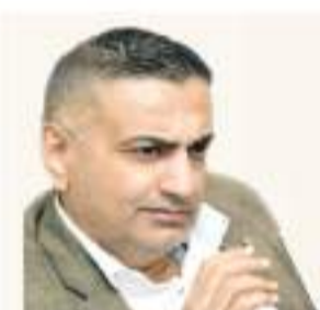
Gaza Groans Amid Clouds of Destruction and Genocide