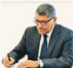
Did Trump retreat from striking Iran... or is this the calm before the storm? Khaled Al-Kharisha