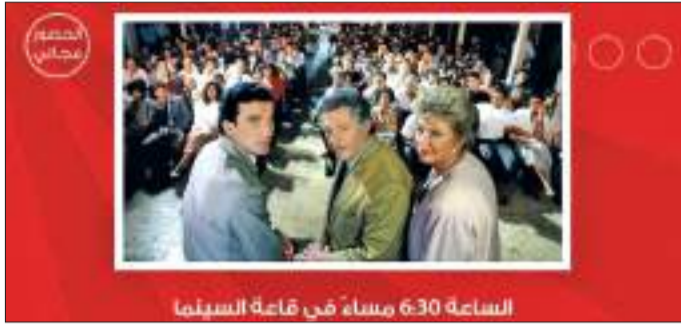
الساعة 6:30 مساءً في قاعة السينما

يشار إلى أن المخرج ايتوري سكولا (١٩٣١-٢٠١٦) من مواليد بلدة صغيرة في جنوب إيطاليا، بدأ مسيرته في كتابة السيناريوهات ومن ثم عمل كمساعد مخرج مع عدد من أقطاب "الواقعية الجديدة" في السينما الإيطالية، ثم أنجز خلال مسيرته المهيدة مجموعة من أبرز الأفلام الإيطالية التي جالت بالكثير من المهرجانات السينمائية العالمية ونالت إعجاب النقاد والجمهور من بينها أفلام: "يوم خاص"، "حفل الرقص"، "العائلة"، وفيلم "قذرون" بشؤون أشرار" الحائز على سبعة مهرجان (كان) السينمائي.