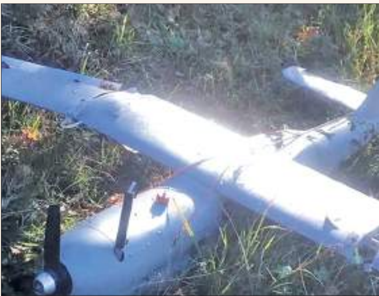
فوق البحر الأسود.

وحثت الحكومة التركية بعد ذلك روسيا وأوكرانيا على الالتزام بأكبر قدر من الحذر