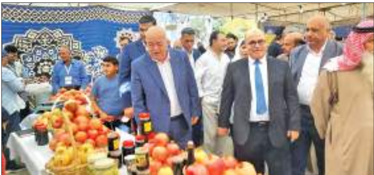
صدي الشعب - عربين مشاعلة

ودّعت محافظة إربد مساء السبت فعاليات مهرجان الرمان والمنتجات الريفية الثاني في ساحة سامح مول بعد ثلاثة أيام مليئة بالبهجة والحيوية، شهدت إقبالًا جماهيريًا واسعًا تجاوز توقعات الموسم الماضي.