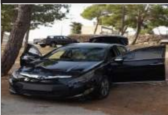
هيوونداي سوناتا تب نظافة موديل 2014