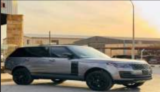
RANGE ROVER VOGUE 2020