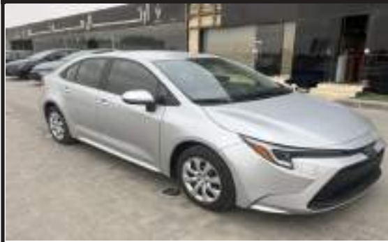
تويوتا كورولا 23 امريكي بدون جمرك حرة بطارية ليثيوم ايون 3 جيد