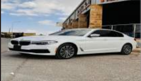
Bmw 530i 2019 plugged in