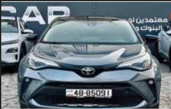
تويوتا chr بالاقساط بدفعه 3300 وقسط يبداء 263