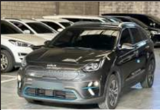
نيرو كهربا 22 كوري فحص اوتوسكور 90 قل إلا فتحه يوجد 5 حبات نيرو