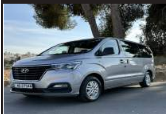
هيوونداي ستركس H1 2018 وارد كوري جمرك جديد فحص كامل قل مشترك اصلي كاش او اقساط بدفعة تبدأ من 3500