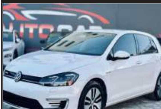
اي جولف ألماني كلين تايتل بدفعة 1450 تسليم مفتاح وقسط شهري 220