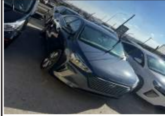
هونداي ايونيك 2019