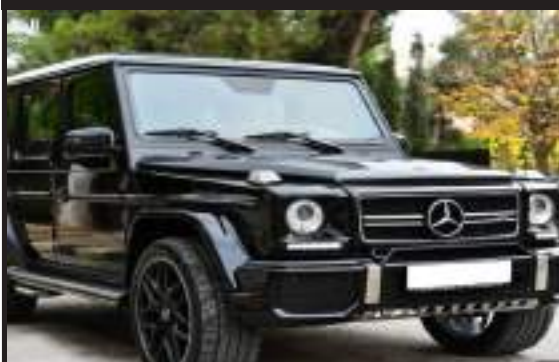
جي كلاس 2010 G55- محمول 2016