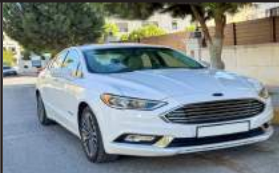
فورد فيوجن تيتانيوم بحال الوكالة كاش أو أقساط