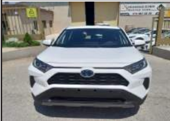
تويوتا rav 4 2020