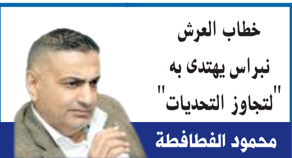
خطاب العرش نبراس يهتدى به "لتجاوز التحديات"