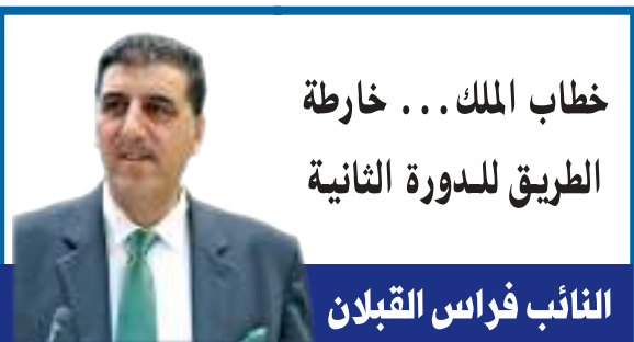
خطاب الملك... خارطة الطريق للدورة الثانية