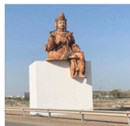
الحائض الآراء الفقهية الإسلامية المختلفة حول نصب التماثيل، ولا تلابد استغراب مواطنيها. وكان متحف "اللوهر" قال إن تمثال "بودا" يعود إلى القرن الحادي والثاني عشر، وتم جلبه من الصين بأيقونة تاريخية إليها.