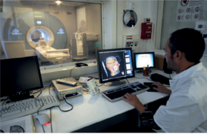
قيد الحياة بفشل الأوكسجين والجلكوز فقط، ولا تستغرق الدماغ سوى ثلاث إلى خمس دقائق ليغني عن ضرر لا رجعة فيه حين يحرم من الأوكسجين والجلكوز. وتطرقت الموقع، سادساً، إلى أن هناك أشخاصاً يمكنهم سماع الألوان أو شم الكلمات وهو ما يسمى "التصاحب الحسي" الذي تم اكتشافه للمرة الأولى في القرن 19، حيث أن هذا الخلط بين الحواس يعد حالة إدراكية. وعلى الرغم من أن "التصاحب الحسي" قد يكون سيءة صدمة دماغية، إلا أن العديد من الأشخاص يظهرون أعراض هذه الحالة منذ سن مبكرة. وأورد الموقع أن الحقيقة السابعة تتمثل في أن الأمر لا يستغرق سوى 20

ثانية كي تلقى في أحدهم، حيث يقول العلم إنه إذا ما تقبلت شخصاً ما لمدة 20 ثانية، فسبحان ذلك شعوراً بالثقة. وعندما تشعر بالأمان، يطلق جسمك هرمون "الأوكسيتوسين" وهو الهرمون ذاته الذي يتم إطلاقه عندما تعانق أحدهم. أما الحقيقة الثامنة فهي أن المال يمكنه شراء السعادة. في الواقع، عندما تنفق المال على غيرك لجعلهم سعداء، فذلك يؤثر على تقديرك لذاتك على نحو إيجابي. وستبدأ برؤية نفسك كشخص أكثر أهمية وكل ذلك يجعلك سعيداً. وأفاد الموقع، أن الأوعية الدموية في دماغك تمتد على حوالي 120 ألف ميل، وهو طول يعادل منتصف الطريق إلى القمر، وتتمثل الحقيقة العاشرة في أن فترة الانتباه لديك لا تتجاوز 4 دقائق وهي أقصر مما كانت عليه قبل 15 سنة، وهو ما يعني أننا عاجزون عن التركيز على أمر واحد لأكثر من 8 ثواني في كل مرة، في المتوسط. وأصبح الموقع أن الاكتئاب يعد أكثر انتشاراً في صفوف الشباب، حيث أن دراسة حديثة كشفت عن أن أكثر الأشخاص تعاسة في العالم تقل أعمارهم عن 30 سنة. ويعتبر الرجال والنساء الذين تتراوح أعمارهم بين 18 و30 سنة هم أكثر عرضة للقلق والتوتر. وفي الختام، بين الموقع أن العلم الواعي أو الصالح يعتبر حقيقياً حيث أنه في هذا النوع من الحلام يمكن للشخص التحكم في نتيجة أحلامه.