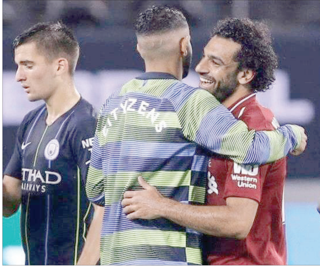
المهارات التقنية الرفيعة والقدرة على تسجيل الأهداف بشكل منتظم، لقد حقق روما الإيطالي ليفيرول الإنجليزي، حيث ساهم بشكل كبير في فوز ليفيرول بلقب دوري أبطال أوروبا في عام 2019 وكان من أفضل لاعبي أوروبا في ذلك الوقت.

محمد صلاح يلعب في مركز الجناح الهجومي ويتميز بالسرعة الفائقة،