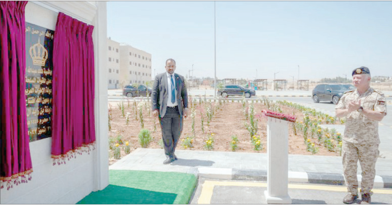
الملك يفتتح مدينة الشيخ خليفة بن زايد آل نهيان السكنية بالزرقاء. حضر الافتتاح نائب رئيس أركان القوات المسلحة في دولة الإمارات العربية المتحدة اللواء الركن أحمد بن طحون آل نهيان، والسفير الإماراتي في عمان الشيخ خليفة بن محمد آل نهيان، وعدد من كبار ضباط القوات المسلحة في البلدين.

• أنشئت بمنحة إماراتية على مساحة 288 دونما ضمن أراضي القوات المسلحة الأردنية