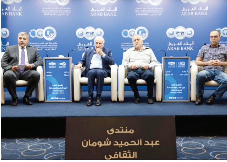
منتدى عبد الحميد شومان الثقافي

والولادة، ومستشفى البشير، ومستشفى الهلال، ومستشفى الأمراض الداخلية، ومستشفى الأطفال، ثم تولى إدارة مستشفى الأذن والأنف والحنجرة بمعمان سنة ١٩٦٢، استقال من وزارة الصحة عام ١٩٦٥ ليعمل في عيادته الخاصة، كان أحد الشركاء المؤسسين للعديد من المجالات منها مجلة «الساعة»، و«المجلة الطبية الأردنية»، وتُخبّر وزيراً للصحة (١٩٨٥-١٩٨٨)، وانتُخب رئيساً لمنظمة الصحة العالمية في جنيف ما بين عام (١٩٨٧-١٩٨٨)، ورئيساً للمجلس العربي للاختصاصات الطبية (١٩٨٧-١٩٨٩) ترأس مجلس وزراء الصحة العرب عام ١٩٨٨، وانتُخب رئيساً للجمعية الوطنية الأردنية لمكافحة التدخين (٢٠٠٩)، وهو عضو في رابطة الكتاب الأردنيين، وانتُخب عضواً في مجلس نقابة الأطباء الأردنية لدورتين متتاليتين (١٩٦٥-١٩٦٩)، ومن أعماله الأدبية «بين الطب والسياسة».