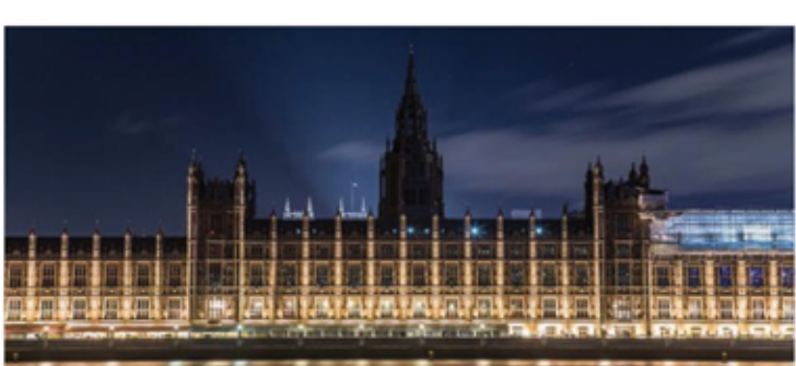
للمبرلمان البريطاني. التقاط الصور، يفرض على جميع الأجهزة الإلكترونية والهواتف أن تكون في وضعية الصامت، ويمنع أعضاء البرلمان من استخدام أي برنامج ترهيفي أو اتصالات مع بعض الاستثناءات القليلة. والتصفيق، ولم يُسمح بالكاميرات في البرلمان إلا عام 1989، على أن يتم تسجيل الجلسة وفقا لأخظمة البث في هيئة الإذاعة البريطانية، ومع ذلك لا يجوز استخدام متلفطات منها في أي برنامج ترهيفي أو برنامج سياسي ناقد، مع بعض الاستثناءات القليلة.

يمكن لأعضاء البرلمان التلويح أو حتى الصراخ، لكن لا يسمح لهم بالتصفيق، تلك القاعدة كسرت في مرات قليلة، واحداها عندما ألقى طوني بلير عام 2007 خطابه الأخير في مجلس العموم. اللغة الإنكليزية، يمنع إلقاء خطاب تحت سقف البرلمان البريطاني بأية لغة عدا الإنكليزية، إلا في حالات تفرضا الضرورة القصوى، رغم أنه في الفترة بين 1916 و1922 كان رئيس الوزراء البريطاني من المتحدثين الأصليين لغة ويلز.