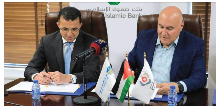
بنك صفاة الإسلامي Islamic Bank

من جهته، أكد التميمي، أن هذا التعاون المشترك الذي يأتي ضمن برنامج مبادرة رفاق السلاح، يعتبر امتداداً للتعاون بين البنك والصندوق العسكري، وأنهم سيواصلون توفير كل ما يلزم لمساندة المتقاعدين من منتسبي القوات المسلحة والأجهزة الأمنية في تأمين مستوى معيشي يليب تطلعاتهم كجزء من المسؤولية الاجتماعية والواجب تجاههم.