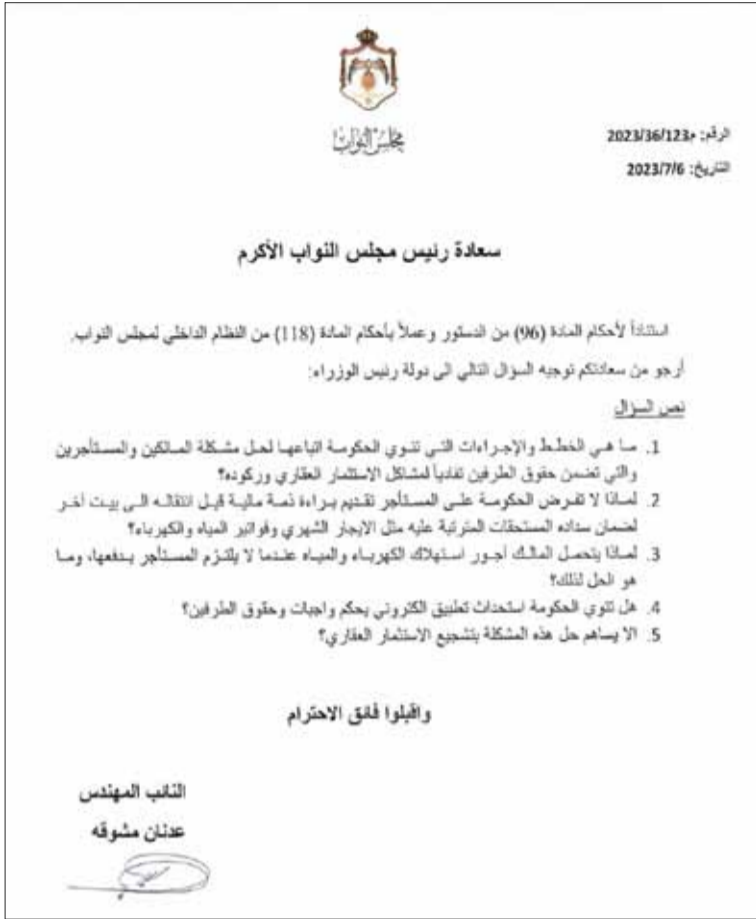
سعادة رئيس مجلس النواب الأكرم

استناداً لأحكام المادة (96) من الدستور وصلاً بأحكام المادة (118) من النظام الداخلي لمجلس النواب.