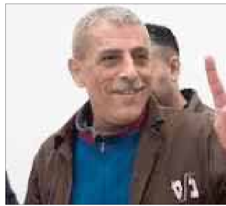
تقرير إدارة السجون.