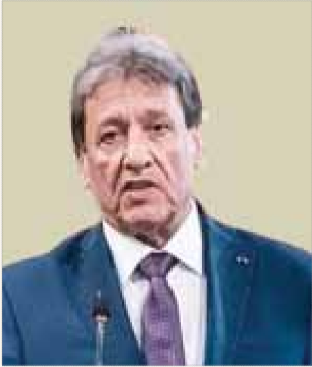
• وزير الشؤون البرلمانية المهندس وجيه عزازية