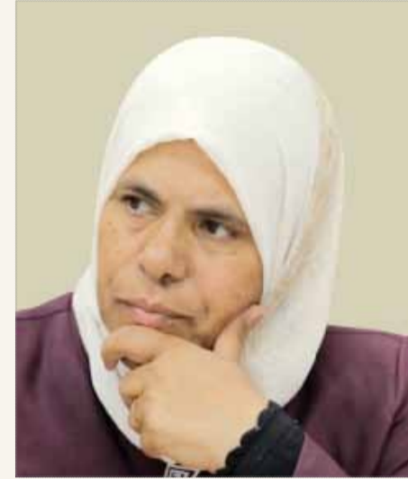
• النائب أسماء الرواحنة