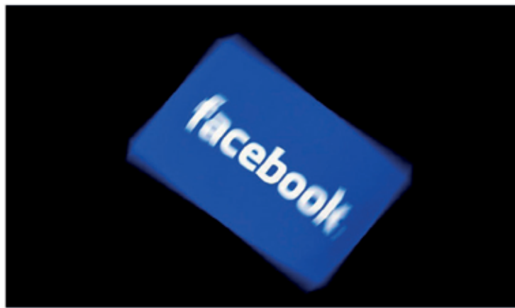
الفيديو شوهد أقل من 200 مرة في المجموع قبل إزالته، وأكد أن «فيسبوك» يعمل على مدار الساعة لمنع ظهور فيديوهات مثل هذه وأصناف، وتمت مشاهدة الفيديو

على موقعه، موضحاً أن الشركة أزلت 1.5 مليون مقطع فيديو لهجوم نيوزيلندا في جميع أنحاء العالم في غضون 24 ساعة بعد إطلاق النار، وتم حظر 1.2 مليون منها عند التحميل. اقرأ أيضاً، فيسبوك تحذف 1.5 مليون فيديو لهجوم المسجونين نيوزيلندا وبت المسح الذي هاجم المسجونين الجمعة الماضي، الهجمات مباشرة عبر خدمة «فيسبوك لايف» لمدة 17 دقيقة، واستمر تداول نسخ من الفيديو على وسائل التواصل الاجتماعي لساعات بعد ذلك، وقالت رئيسة الوزراء جاسيندا أوديرن إنها تريد مناقشة البث الحي مع «فيسبوك». يشار إلى أن 50 مسلماً راحوا ضحية الهجوم الذي استهدف مسجونين في نيوزيلندا، وأسبب العشرات.