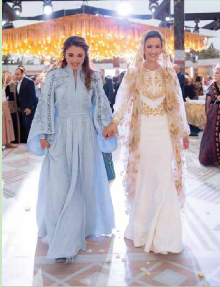
"May you always be each other's source of happiness and support," she said. The Queen also noted

"I'll never forget how happy His Majesty and I were when Al Hussein told us he wanted to marry Rajwa. She is the perfect answer to all my prayers for him," Her Majesty reflected, before wishing the couple a blessed and happy future.