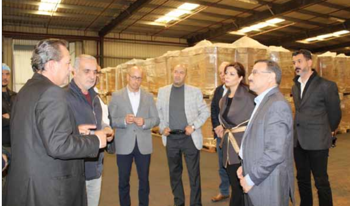
مشايع الطاقة الشمسية، وبقية استثمار كلية بلغت حوالي 450 مليون والتصميم بلغ 54 مصنعا لمستثمرين أردنيين وعرب وأجانب. كما وفرت تلك الاستثمارات 1300 فرصة عمل، منها 70 بالمتة من أبناء المفرق، مشيراً إلى أن المصانع التي ما تزال تحت التصميم والإنشاء

ويعتبر الاستثمار في المناطق التنموية أحد المكونات الرئيسية في المحفظة الاستثمارية لصندوق استثمار أموال الضمان الاجتماعي، لتعزيز العائد المتوقع على الاستثمارات المتعددة في قطاعات مختلفة منها البنوك، التعدين، الصناعات الدوائية، السياحة والمحفظة العقارية، بالإضافة إلى الدور المهم لتلك المناطق في تعزيز التنمية الاقتصادية والاجتماعية في المحافظات.