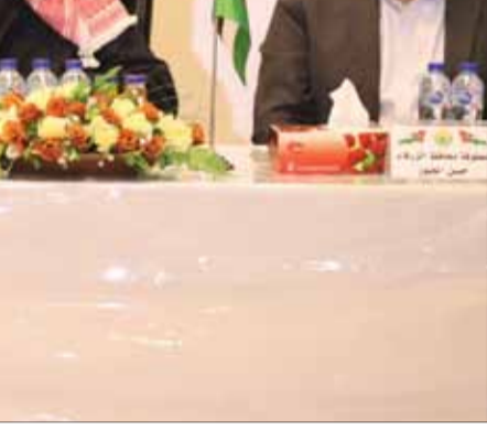
يهدف لتسهيل عملية السداد بشكل ميسر، مما يساعد البلديات في الحصول على ديونها أولا بأول.

وأشار كريشان خلال زيارته لبلدية الهاشمية الجديدة - التي حضرها النائبان الدكتور عمر الزبيد والدكتور سليمان القلاب - إلى أن مشاكل البلديات متشابهة، والتي أبرزها مديونية وصلت إلى حوالي 350 مليون دينار، فيما تبلغ ديون البلديات على المواطنين ما يقارب من هذه المديونية، وجدد التأكيد على ضرورة تقسيط ديون البلديات على المواطنين