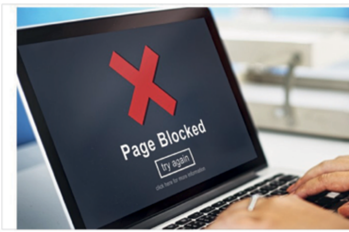
لكن بعد إبراز واحدة من هذه الوثائق. "حجب المواد الإباحية" عام ٢٠١٧، وأقر هذا القانون المعروف باسم

الشهر القادم، لكن يمكن أن يطرا تأجيل على تطبيقه، حيث أن وزارة الرقمية والثقافة والرياضة والإعلام، لم تؤكد ما إذا كان التاريخ السابق ما يزال ساريا، لكن وسائل إعلام بريطانيا أوضحت أن التطبيق "وشيك". وتشير إحصائيات مؤسسات معنية بحماية الأطفال، إلى أن نحو نصف الأطفال والمراهقين الذين تقل أعمارهم عن ١٨ في بريطانيا يوافقون على الدخول للمواقع الإباحية. لكن هناك من يشكك في نجاح هذه الإجراءات في إبعاد هؤلاء عن تلك المواقع، لأسباب، منها ما يتعلق بكيفية رصد المواقع الإباحية غير المعروفة، وإمكانية سرقة البطاقات الشخصية لأخريين واستخدامها لهذا الغرض.