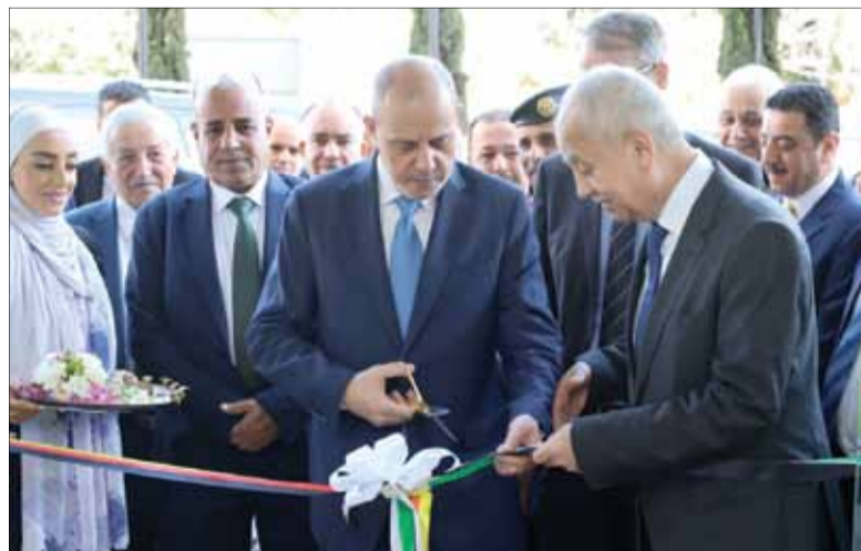
عمان- ندى جمال

افتتح وزير العمل يوسف الشمالي، وحدة التشغيل في القطاع الصناعي، التي تأسست من قبل غرفة صناعة عمان بالتعاون مع مشروع التشغيل في الأردن 2030 المنفذ من قبل الوكالة الألمانية للتعاون الدولي (GIZ)، بهدف توفير العمالة المؤهلة اللازمة للصناعة بالتوازي مع تشغيل المزيد من الأيدي العاملة الوطنية في الشركات الصناعية.