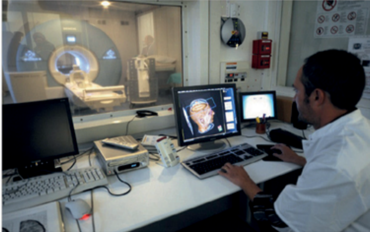
في ذلك إلى أن من يتمتعون بعدل ذكاء عال يشعرون أن التواصل عبارة عن مضيعة للوقت. مع ذلك، توصلت دراسات أخرى إلى أن إحاطة نفسك بالناس يغذي صحتك العقلية وهو ما يجعل العديد من الأشخاص الأكثر ذكاء هم الأكثر اكتئابا. أقرأ أيضا، مفاجأة.. جهاز يحول الأفكار لكلام منطوق.. لهذا رُحِب العلماء وأضاف الموقع أن الحقيقة الرابعة تتجسد في أن لدينا عددا من الأفكار في اليوم أكبر مما نتصور، حيث أن الدماغ البشري تدور فيه حوالي ٧٠ ألف فكرة يوميا، ٧٠ بالمئة منها تكون سلبية، على سبيل المثال، وأورد الموقع أن الحقيقة السابعة تتمثل في أن الأمر لا يستغرق سوى ٢٠

ثانية كي تتلق في أحدهم، حيث يقول العلم إنه إذا ما تقبلت شخصا ما لمدة ٢٠ ثانية، فسيتلقى ذلك شعورا بالثقة. وعندما تشعر بالأمان، يطلق جسمك هرمون "الأوكسيتوسين" وهو الهرمون ذاته الذي يتم إطلاقه عندما تعانق أحدهم. أما الحقيقة الثامنة فهي أن المال يمكنه شراء السعادة. في الواقع، عندما تنفق المال على غيرك يجعلهم سعداء، لذلك يؤثر على تفكيرك لذاتك على نحو إيجابي. وستبدأ برؤية نفسك كشخص أكثر أهمية وكل ذلك يجعلك سعيدا. وأضاد الموقع، تأسعا، أن الأوعية الدموية في دماغك تعتمد على حوالي ١٢٠ ألف ميل، وهو طول يعادل منتصف الطريق إلى القمر. وتتمثل الحقيقة العاشرة في أن فترة الانتباه لديك لا تتجاوز ٤ ثواني وهي أقصر مما كانت عليه قبل ١٥ سنة، وهو ما يعني أننا عاجزون عن التركيز على أمر واحد لأكثر من ٤ ثواني في كل مرة، في المتوسط. وأوضح الموقع أن الاكتئاب بعد أكثر انتشارا في صفوف الشباب، حيث أن دراسة حديثة كشفت عن أن أكثر الأشخاص تعاسة في العالم تقل أعمارهم عن ٣٠ سنة، ويعتبر الرجال والنساء الذين تتراوح أعمارهم بين ١٨ و٣٠ سنة هم أكثر عرضة للتوتر. وفي الختام، بين الموقع أن الحلم الواعي أو الصلي يعتبر حقيقيا حيث أنه في هذا النوع من الأحلام يمكن للشخص التحكم في نتيجة أحلامه.