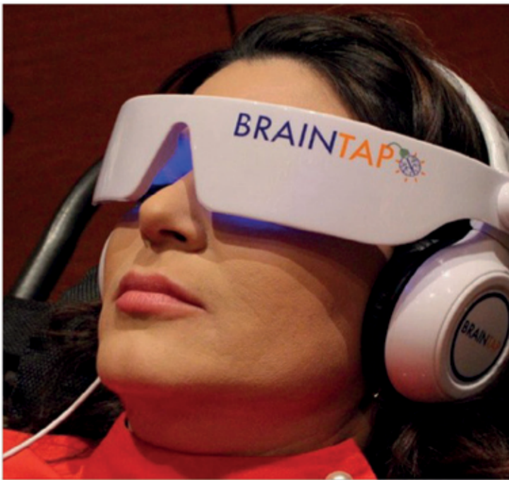
انسداد مفاجئ على مستوى شريان أو أكثر من الشرايين الصغيرة في القلب، أي الشرايين التاجية، بسبب تشنجات شريانية متتالية جراء التدفق الهائل من الكاتيكولامينات المرتبطة بالإجهاد الناتج عن الخوف أو الألم أو الفرح الشديد، ويؤثر هذا في الغالب على النساء وبالأحرى النساء المسنات اللاتي لهن ظروف نفسية خاصة". ومن المعروف أن الدماغ ينظم تآشيرات الإجهاد، وهذا التفاعل العصبي يؤدي إلى إنتاج هرمونات، وهي

الكاتيكولامينات التي تفرزها الغدة الكظرية، ويخضع هذا الإنتاج لتطورات طبيعية تحت سيطرة الجهاز العصبي الودي، الذي يتحكم فيه الجهاز العصبي المركزي، والأسباب غير مبررة، تتراشق هذه المتلازمة مع إنتاج هائل وغير متناسب من الكاتيكولامينات. وفي سؤال الموقع عن مدى خطورة هذه المتلازمة، وما إذا كان الأشخاص الذين يعانون من أمراض القلب أكثر عرضة لهذه الحالة، أجاب أخصائي القلب بأن "نقص التروية الحاد لعضلات القلب يمكن أن يكون سببا في ظهور أعراض مفاجئة على غرار الإغماء أو السكتات القلبية بسبب عدم انتظام دقات القلب، التي تتلبد لتدليك القلب وسددة كبريائية خارجية لمنع الموت المفاجئ، وعلى المدى الطويل، يؤدي الانقباض العضلي إلى قصور في القلب، الأمر الذي يمكن أن يكون له غاية الخطورة". الجدير بالذكر أنه في كثير من الأحيان، وبالنسبة للنساء المسنات، يمكن أن تساهم بعض عوامل الخطر المعتادة، من قبيل مرض السكري وضغط الدم والكوليسترول، في تعقيد الحالة، لكن من حيث المبدأ، لا تؤثر هذه المتلازمة على المرضى الذين يعانون من قصور الشريان التاجي المزمن، مع ذلك، فمن المعروف أن الإجهاد المزمن هو عامل خطر، وأن الإجهاد الحاد يمكن أن يؤدي إلى نوبة قلبية. وفي الختام، أشار المختص إلى أن "هناك بعض الأدوية التي تساعد على خفض معدل ضربات القلب مثل محصر بيتا، الذي يوصى به لمنع هذا التسارع المفاجئ والسرعة لتبضات القلب، التي تستهلك الأكسجين".