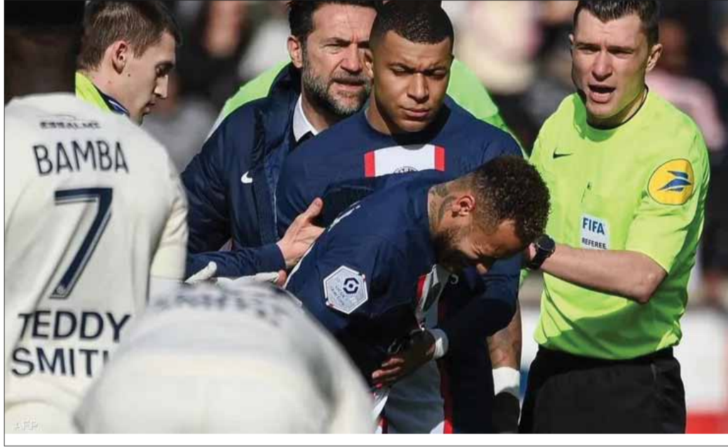
نيمار حاليا في باريس سان جيرمان، تحدث عن الأمر عام 2017 عندما كان لاعبا في صفوف ريال مدريد، وقال ساخرا: «نرحب بانضمام نيمار فهو لاعب كبير وأحب اللعب معه، لكن علينا أولا التفاوض معه حول عيد ميلاد شقيقته».

عادوت الإصابة النجم البرازيلي نيمار لاعب باريس سان جيرمان في موعدها السنوي المعتاد، خلال مواجهة فريقه ضد ليل في الدوري الفرنسي قبل أيام، ليغادر اللاعب باكيا وسط تساؤلات كثيرة حول «لغز اللعنة السنوية». اشتهر نيمار بتعرضه للإصابات كل عام قبل نهاية شهر فبراير أو في بداية مارس، قبل أيام من موعد عيد ميلاد شقيقته رافائلا الذي يوافق يوم 11 من المعتاد في نفس الموعد وشيئا، حيث أعلن باريس سان جيرمان تعرض نيمار لإصابة بالالتواء في الكاحل، ليحتاج إلى فترة علاج وتأهيل قد تصل إلى 3 أسابيع. على الأقل. وجه البعض الاتهامات لنيمار بتعمد الغياب عن الملاعب ليكون إلى جوار شقيقته في يوم احتفالها بذكرى مولدها، نظرا لامتنع الثنائي بعلاقة رائعة تعكسها دائما مواقع التواصل الاجتماعي وعدسات المصورين. ويعتز نيمار كثيرا بشقيقته للدرجة التي جعلته يضع صورتها وشما على ذراعه، ويرافقها دائما في مناسباتها المهمة. المدافع الإسباني سيرجيو راموس زميل