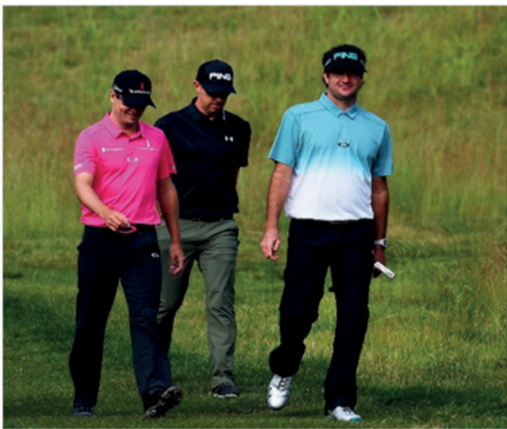
على جهاز المشي بعد نهاية الساعة الأولى، والثالث كالثاني، لكن مع إضافة ثلاث دقائق من المشي لاحقا خلال اليوم. تم العثور على أن المشي للرجال والنساء خفض ضغط الدم الانقباضي، الذي يعد مؤشرا قويا لمشاكل القلب.

اقرأ أيضا: تعرف إلى التغييرات التي تحدث في الجسم كل ١٠ سنوات كما أن النساء استلذدن على وجه الخصوص من الجسولات الإضافية الصغيرة. كما أظهرت دراسة نشرت في دورية جمعية القلب الأمريكية لضغط الدم، مؤلفها الرئيسي مايكل ويلر، أن كبار السن قد يستفيدون بشكل خاص من التمارين الصباحية. ويقول العلماء إن صعود الدرج أو غسل السيارة أو حمل أغراض التسوق كلها أمور يمكن أن تعزز من الصحة، خاصة للأشخاص الذين يعانون من السمنة، كما أن الأعمال المنزلية البسيطة أيضا مفيدة.