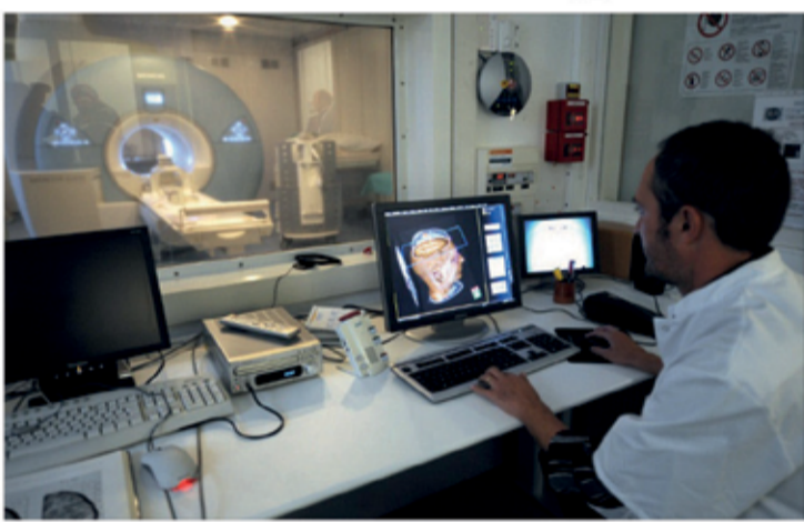
قيد الحياة بفضل الأوكسجين والجلوكوز فقط. ولا يستغرق الدماغ سوى ثلاث إلى خمس دقائق ليوانى من ضرر لا رجعة فيه حين يحرم من الأوكسجين والجلوكوز. وتطرق الموقع، سادسا، إلى أن هناك أخصا يمكنهم سماع الألوان أو شم الكلمات وهو ما يسمى "التصاحب الحسي" الذي تم اكتشافه للمرة الأولى في القرن ١٩، حيث أن هذا الخلط بين الحواس يتجسد في أن لدينا عددا من الأفكار في اليوم أكبر مما نتصور، حيث أن الدماغ البشري تدور فيه حوالي ٧٠ ألف فكرة يوميا، ٧٠ بالمئة منها تكون سلبية. على سعيد آخر، تتمثل الحقيقة السابعة في أن خلايا الدماغ بمقدورها البقاء على

ثانية كي تلقى ب أحدهم، حيث يقول العلم إنه إذا ما تقبلت شخصا ما لمدة ٢٠ ثانية، فسيتعلق ذلك شعورا بالثقة. وعندما تشعر بالأمان، يطلق جسمك هرمون "الأوكستوسين" وهو الهرمون ذاته الذي يتم إطلاقه عندما تعانق أحدهم. أما الحقيقة الثامنة فهي أن المال يمكنه شراء السعادة. في الواقع، عندما تنفق المال على غيرك يجعلهم سعداء، لذلك يؤثر على تقديرك لذاتك على نحو إيجابي. وستبدأ برؤية نفسك كشخص أكثر أهمية وكل ذلك يجعلك سعيدا. وأفراد الموقع، تاسعا، أن الأوعية الدموية في دماغك تمتد على حوالي ١٢٠ ألف ميل، وهو طول يعادل ممتد الطريق إلى القمر. وتمثل الحقيقة العاشرة في أن فترة الانتباه لديك لا تتجاوز ٤ ثواني وهي أقصر مما كانت عليه قبل ١٥ سنة، وهو ما يعني أننا عاجزون عن التركيز على أمر واحد لأكثر من ٨ ثواني في كل مرة، في المتوسط. وأوضح الموقع أن الاكتئاب يعد أكثر انتشارا في صفوف الشباب، حيث أن دراسة حديثة كشفت عن أن أكثر الأشخاص تعاسة في العالم تقل أعمارهم عن ٣٠ سنة. ويعتبر الرجال والنساء الذين تتراوح أعمارهم بين ١٨ و٣٠ سنة هم أكثر عرضة للقلق والتوتر. وفي الختام، بين الموقع أن الحلم الواعي أو الصلي يعتبر حقيقيا حيث أنه في هذا النوع من الأحلام يمكن للشخص التحكم في نتيجة أحلامه.