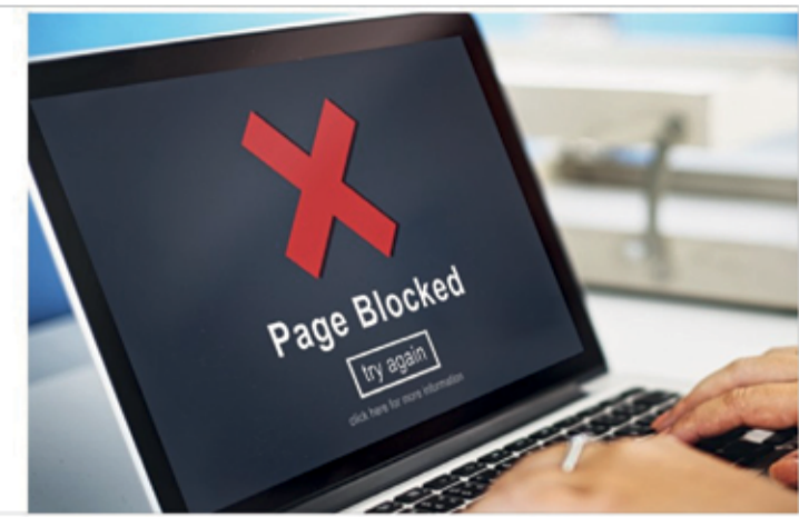
لكن بعد إبراز واحدة من هذه الوثائق، وأقر هذا الناقلون المعروف باسم "حجب المواد الإباحية" عام 2017، ومن المفترض أن يدخل حيز التنفيذ

الشهر القادم، لكن يمكن أن يطرأ تأجيل على تطبيقه، حيث أن وزارة الرقعات وما إذا كان التاريخ السابق ما يزال سارياً، لكن وسائل إعلام بريطانيا أوضحت أن التطبيق "شيك". وتشير إحصائيات مؤسسات معنية بحماية الأطفال، إلى أن نحو نصف الأطفال والمراهقين الذين تقل أعمارهم عن 18 في بريطانيا يوافقون على الدخول للمواقع الإباحية. لكن هناك من يشكك في نجاح هذه الإجراءات في إبعاد هؤلاء عن تلك المواقع، لأسباب منها ما يتعلق بكيفية رصد المواقع الإباحية غير المعروفة، وإمكانية سرقة البطاقات الشخصية لأخرين واستخدامها لهذا الغرض.