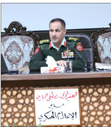
إجازات الوطن وصون الوحدة الوطنية. أكد مدير الإعلام العسكري أن استراتيجية القوات المسلحة الإعلامية هي جزء من

وفي نهاية الحاضرة جرى نقاش موسع أجاب خلاله المحاضر على أسئلة الدارسين.