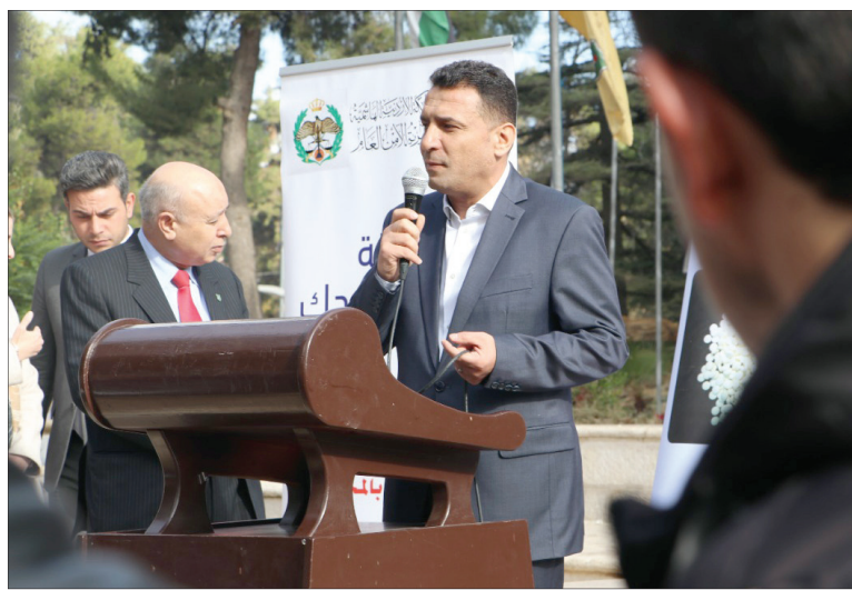
صدى الشعب - محمد عضيبات

أقام مركز تنمية وخدمة المجتمع اليوم، الأربعاء، بالتعاون مع مديرية الأمن العام والجامعة الأردنية نشاطاً توعوياً لتخدير الطلبة من خطورة المخدرات والنتائج المترتبة على تعاطيها. وتضمن النشاط معرضاً قدمته إدارة مكافحة المخدرات لأكثر أنواع المخدرات شيوعاً وانتشاراً بين المروجين، بهدف تحذير الطلبة منها وتعريفهم بها وبالأشكال والأنواع التي يسعى تجار المخدرات لترويجها. كما قدم النشاط مجموعة «بروشورات» توعوية تتضمن نصائح حول كيفية الإكتشاف المبكر للمتعاطين وتصحيح بعض المفاهيم الخاطئة حول المخدرات وتعاطيها. الصراير: هذه النشاطات تسعى لخفض الطلب على المخدرات وقال نائب مدير إدارة مكافحة المخدرات العقيد أيمن الصراير إن النشاط يأتي ضمن الحملة التي تقوم بها مديرية الأمن العام لتوعية كافة فئات المجتمع بخطورة المخدرات. وأضاف الصراير إن هذا النوع من