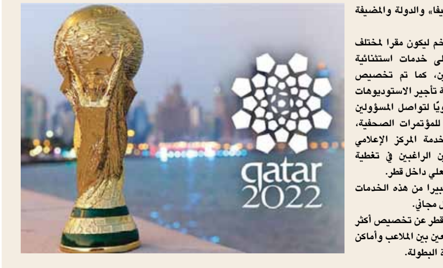
حفل افتتاح استثنائي لكأس العالم في الدوحة اليوم