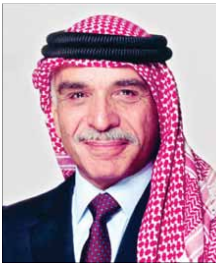
وتمكن الأردن في عهد الملك الحسين، من إقامة شبكة من العلاقات الدولية القائمة على الاحترام المتبادل والمصالح المشتركة مع عدد كبير من دول العالم.

وقام الراحل الكبير في العام 1991 بدور رئيس في عقد مؤتمر مدريد للسلام من خلال توفير مظلة للفلسطينيين للتفاوض حول مستقبلهم من خلال وفد أردني فلسطيني مشترك، ويعد نحو عامين وفي الثالث عشر من أيلول 1993 وقعت منظمة التحرير الفلسطينية وإسرائيل إعلان مبادئ (أوسلو 1) حددنا فيه أطر للتفاوض معاً، ومهد ذلك الطريق أمام الأردن للسير في مسار التفاوض الخاص به مع إسرائيل، وقد تم توقيع إعلان واشنطن في الخامس والعشرين من تموز 1994 الذي أنهى رسمياً حالة الحرب بين الأردن وإسرائيل والتي استمرت زهاء 46 عاماً.