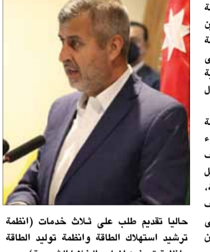
اكاد وزير الطاقة والثروة المعدنية الدكتور صالح الخرابشة، ان اطلاق المنصتين الالكترونيتين الذي تم ضمن حفل اختتام الدورة الثانية من المسرعات الحكومية، سيعمل على زيادة الاستثمار في مجال الثروات المعدنية وتحسين مستوى الخدمات المقدمة من خلال التحول الالكتروني.

اجراءات رحلة المستثمر في الثروات المعدنية وتهدف الى الربط البيئي بين الجهات المعنية لتقليل الزمن والعبء اللازم للحصول على الخدمة، والاستغناء عن الوثائق الورقية، وتقليل زمن الحصول على الخدمة. أكد ان دور وجهد وزارة الطاقة تسندة جيات شركة تشمل وزارات البيئة والزراعة والإدارة المحلية ودائرة الأراضي والمساحة وهيئة تنظيم هيئة تنظيم قطاع الطاقة والمعادن. ووصف الخرابشة المنصات الالكترونية بأنها بداية لإطلاق خدمات أكثر شمولاً لتحسين الخدمات في مختلف القطاعات ولتشجيع الاستثمار في الثروات المعدنية من خلال التطوير الدائم للمنصة لتتماشى مع متطلبات واحتياجات المستثمرين وتشجع على جذب مزيد من فرص الاستثمار في هذا القطاع المهم في الاقتصاد الوطني.