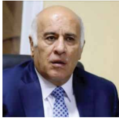
أخترنا أبطال الدوري والكأس، حيث اختير شباب الخليل وجبل المبر وشباب رفح، وأردف: «نقدر قرار الاتحاد الأردني بإتاحة الفرصة لفرق الوحدات والفصلي والرمنا

المشاركة بكافة نجومهم الدوليين، وبما يعزز من نجاح البطولة، وهو موقف مشترك ففرقتنا الفلسطينية كذلك ستشارك بكافة النجوم». ولغت الرجوب، إلى أن الفرق المشاركة في الضفة صاحبة شعبية كبيرة، وبالتالي البطولة ستحظى بحضور جماهيري كبير وبخاصة شباب الخليل. وأكد الرجوب، أن فرقي الوحدات والفصلي لهما جماهيرتهما الكبيرة في فلسطين، وسيق لهما اللعب في ملاعبنا، وستقوم بتزيين المدرجات ترحيباً بالفرق المشاركة.