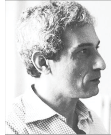
صدي الشعب - سليمان أبو خرمة

يصادف اليوم الثلاثاء، الموافق للـ 29 من اب أغسطس، الذكرى السنوية لاغتيال الفنان الكاريكاتيري الفلسطيني المعروف ناجي العلي بعد غيبوبة طويلة دخل فيها، إثر إطلاق النار تجاهه في العاصمة البريطانية لندن.