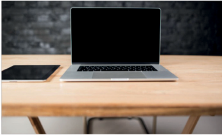
نسخة مايكروسوفت ويندوز القديمة. وفي هذه الحالة، يعمل الاختيار غير المناسب لبرنامج مكافحة الفيروسات على إبطاء جهاز الكمبيوتر، ويقلل من فرص ضمان حماية موثوقة للجهاز.

التي يمكن أن تبطن من سرعة عمل النظام إلى حد كبير. من هذا المنطلق، من الممكن نقل بعض المعلومات والبيانات إلى محرك القرص الصلب القابل للازالة، الأمر الذي يتيح لجهاز الكمبيوتر القيام بمهام بشكل أسرع، ويعمل على توفير مساحة كبيرة لتخزين الملفات. وفي حال كنت لا تحتاج إلى ميزة التشغيل التلقائي للجهاز، فمن الضروري إلغاؤها، وهو ما سيسمح بتشغيل الجهاز بشكل سريع، وتنفيذ المهام بشكل أسرع وكفاءة أكبر. وأشار الموقع إلى خطأ كبير يرتكبه الكثيرون منا، ويؤثر سلباً على سرعة جهاز الكمبيوتر، ويتمثل في تفعيل وضع السكون على الجهاز بدلاً من إيقاف تشغيله ليلاً. في الواقع، يمكن القيام بذلك في بعض الأحيان، إلا أن الإفراط في اللجوء إلى هذا الأمر يؤثر على سلامة الجهاز، وعلى قدرته على التعامل مع المهام. لذلك، يجب إيقاف تشغيل الجهاز، لضمان حصوله على القليل من الراحة، ما يعزز معدل سرعته. علاوة على ذلك، يساعد تثبيث برنامج «سي كلينر»، الذي يستخدم لتحسين أداء الحاسوب وتنظيفه بشكل سريع، فضلاً عن تنظيف السجل وحذف الملفات المؤقتة والتخلص من الأخطاء في النظام، وكذلك أداء عدد من الوظائف، على تعزيز سرعة الجهاز. وفي الختام، نوه الموقع بأن نظام التشغيل يقدم غالباً برامج تشغيل تلقائية، وغالباً ما تكون مناسبة فقط لأحدث الموديلات من أجهزة الكمبيوتر، لكن في حال كان عمر جهازك قد تجاوز ثلاث سنوات فتجنب تثبيث هذه البرامج، وقم بإلغاء برنامج التشغيل التلقائي، للمحافظة على الجهاز، وضمان قيامه بمهامه بشكل سريع.