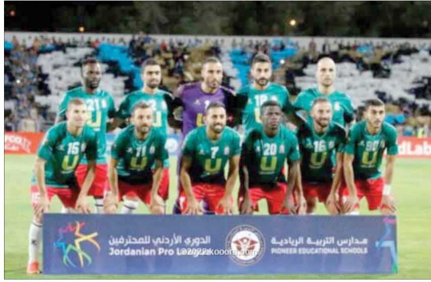
شباب الأردن مع شباب نزال، منافسه الأهلي على استاد الحسن، عمان الدولي، ويلعب شباب العقبة على استاد الملك عبدالله الثاني بإربد، كما يواجه الفيصلي «حامل اللقب» فريق الطرة، على استاد بالزرقاء.

حقق الوحدات فوزاً كاسحاً على الحصن «5-0»، في مواجهة التي جرت مساء الجمعة، على استاد الملك عبدالله الثاني بالقويسمة، ضمن دور الـ32 لبطولة كأس الأردن، ليضمن بذلك تأهله للدور ثمن النهائي.